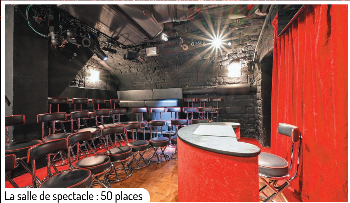
La salle de spectacle : 50 places