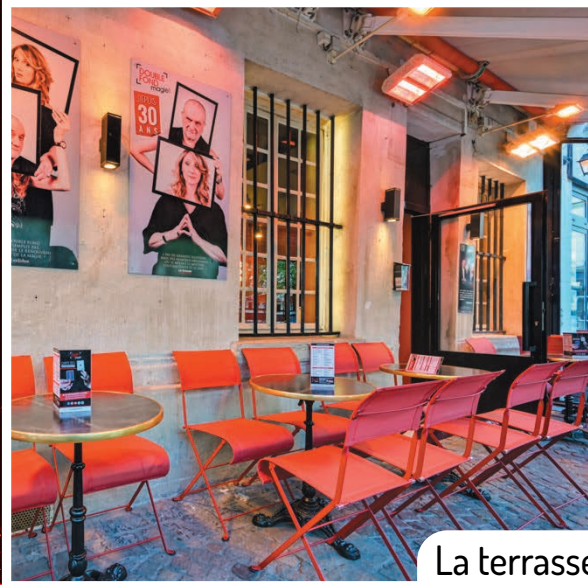
La terrasse : 35 places