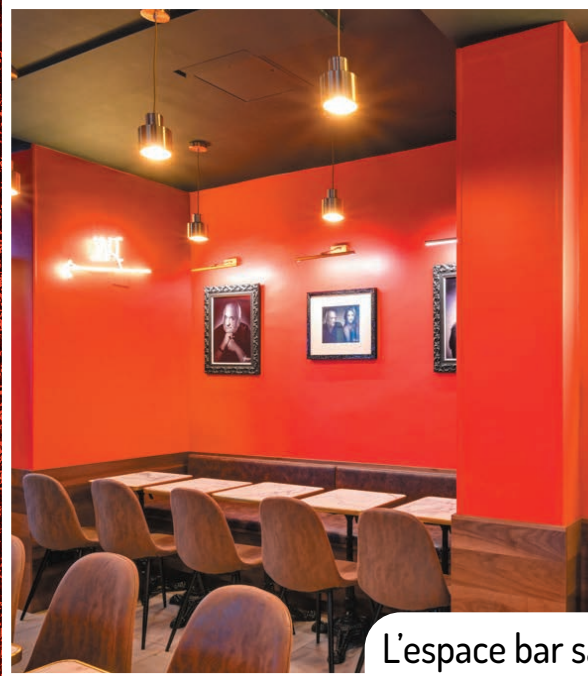
L'espace bar salon : 35 places